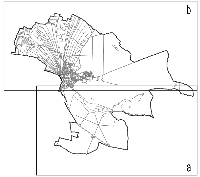
SCHEMA K.Ú. JABKENICE 1:80 000