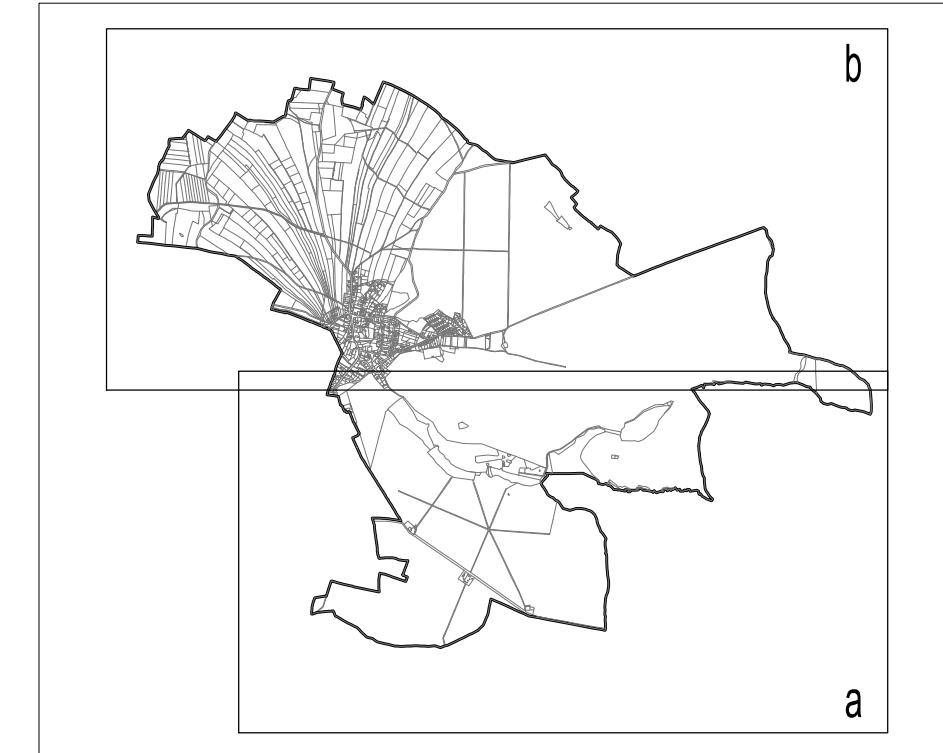
SCHEMA K.Ú. JABKENICE 1:60 000