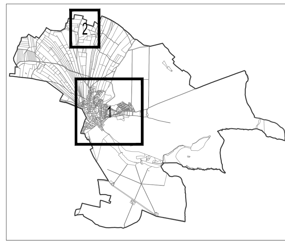
SCHEMA k.ú. JABKENICE 1:50 000